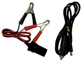
PRZEWODY ZASILANIA 12V