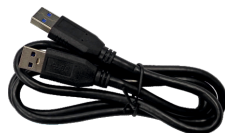
PRZEWÓD USB 3.0